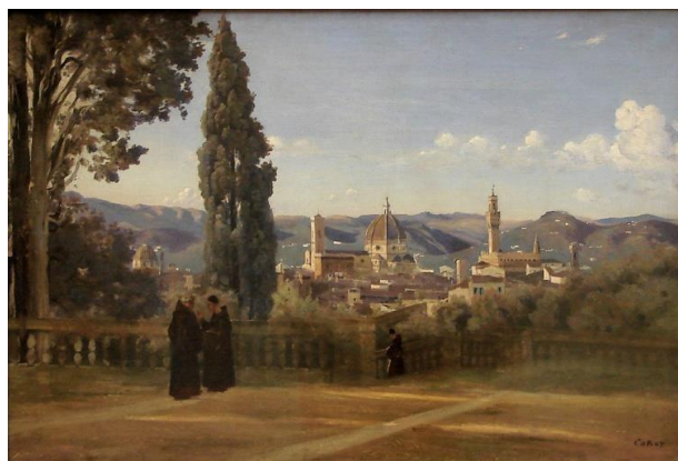
Florence - Camille Corot - Louvre